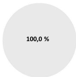
1. Taxonomiekonformität der Investitionen einschließlich Staatsanleihen*

Taxonomiekonform (ohne fossiles Gas und Kernenergie) Nicht taxonomiekonform