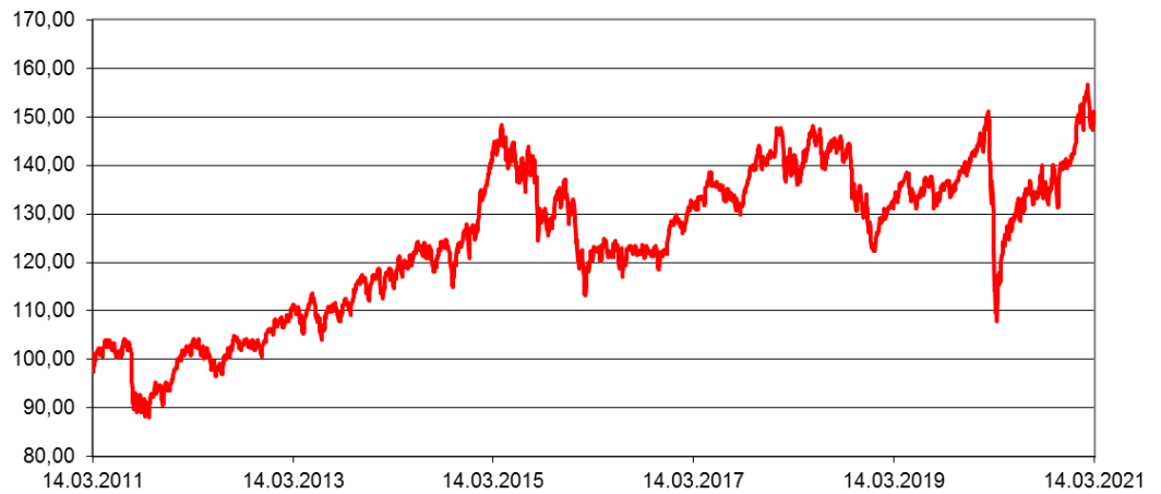
Entwicklung des Fondspreises (in €) Rücknahmepreise - um Ausschüttungen / Thesaurierungen bereinigt

Durchschnittliche Jahreswertentwicklung: