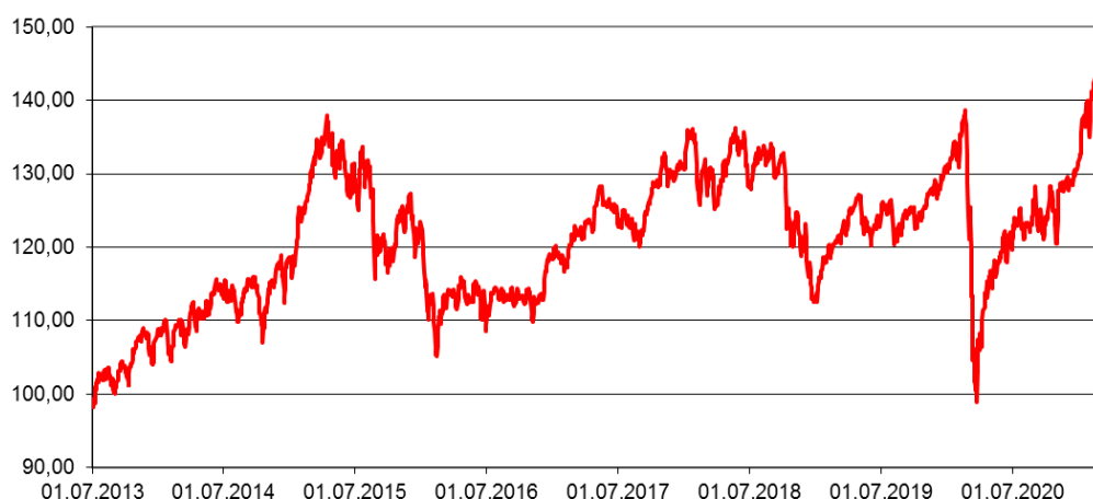
Entwicklung des Fondspreises (in €) Rücknahmepreise - um Ausschüttungen / Thesaurierungen bereinigt

Durchschnittliche Jahreswertentwicklung: