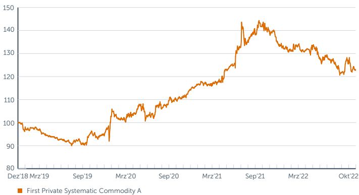
■ First Private Systematic Commodity A

Wertentwicklung des First Private Systematic Commodity A seit Auflegung; Berechnung der Wertentwicklung nach BVI-Methode, d.h. ohne Berücksichtigung des Ausgabeaufschlages. Wertentwicklungen in der Vergangenheit sind kein verlässlicher Indikator für die zukünftige Wertentwicklung.