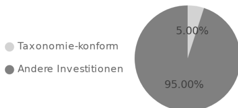
1. Taxonomie-Konformität der Investitionen einschließlich Staatsanleihen*