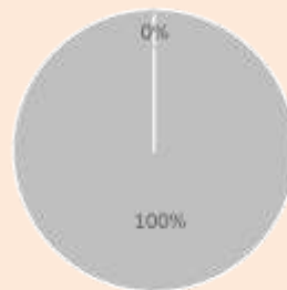
1. Taxonomie-Konformität der Investitionen einschließlich Staatsanleihen

■ Taxonomiekonform ■ Nicht taxonomiekonform