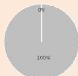
2. Taxonomie-Konformität der Investitionen ohne Staatsanleihen

■ Taxonomiekonform ■ Nicht taxonomiekonform Diese Grafik gibt 100 % der Gesamtinvestitionen wieder