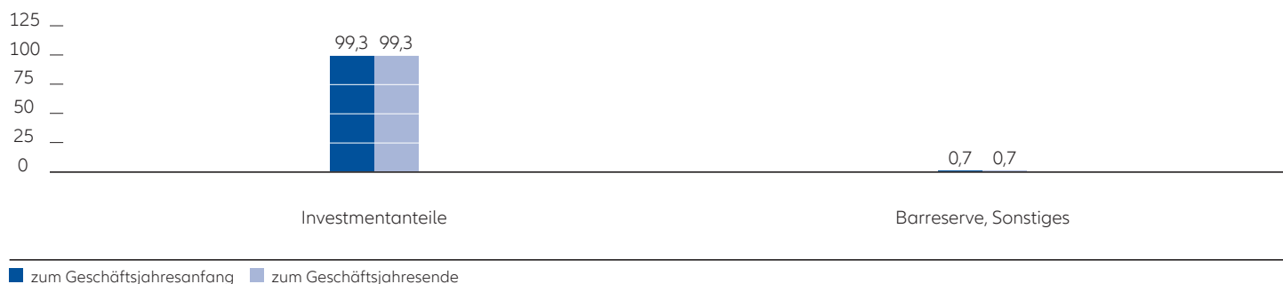
Struktur des Fondsvermögens in %