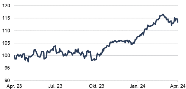
Wertentwicklung im Geschäftsjahr (in %) HAL European Dividends RA