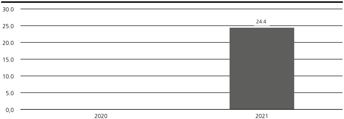
Historische Wertentwicklung WeltInvest Nachhaltigkeit (Angabe in %)

Absolute Wertentwicklung vergangener Zeiträume bezogen auf volle Kalenderjahre (Stand 31. Dezember 2021).