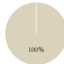
2. Taxonomie-Ausrichtung von Investitionen ohne Staatsanleihen*

■ Taxonomiekonform ■ Andere Investitionen