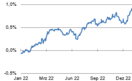
XAIA Credit Basis (I)