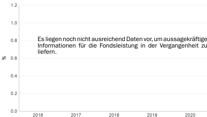
■ AXA WF Emerging Markets Euro Denominated Bonds E Distribution (Q) EUR (ISIN : LU2131352283)

Der Teilfonds wurde am 03/03/2020 und die Anteilsklasse im 2020 aufgelegt.